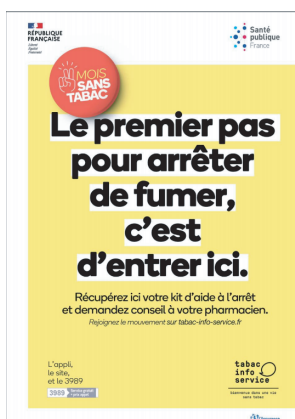
Affiche Pharmacie et Hôpitaux